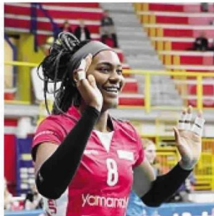
Martinez ancora trascinatrice

Farfalle che, esattamente come successo giovedì, partono soft. Contro un avversario di rango modesto non riescono subito a prendere il largo e, anzi, devono rincorrere il 7-11 iniziale.